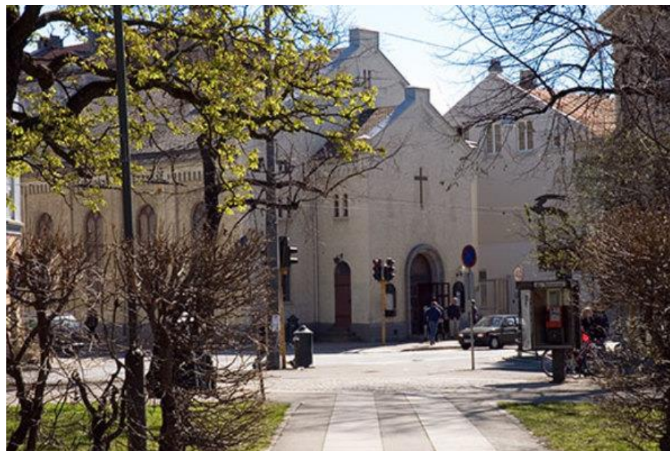
Metodistkirken Grünerløkka, Oslos eldste frikirke